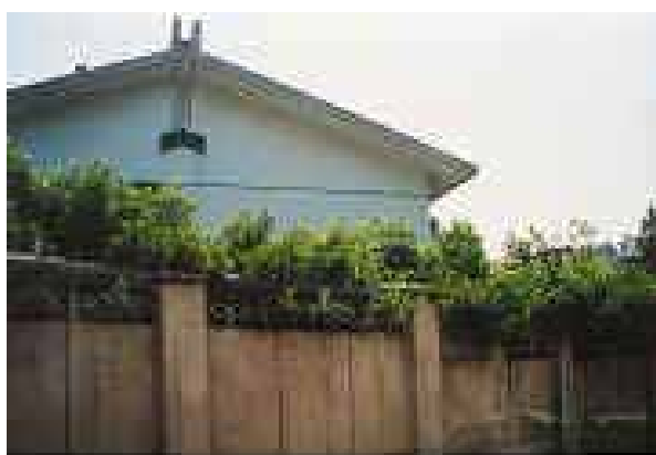
幽禁地点——无锡市郊的一个招待所

8月16日，丁接到一位法国友人的电话，说要来无锡看望他们。丁在电话里告诉那位法国友人，她将于18日回京，可于下周四在北京家里会面。当时，北京正召开世界妇女大会，但丁的这次返京却与妇女大会无关，而是要去北京的中国银行办理一笔来自香港的人道捐款。